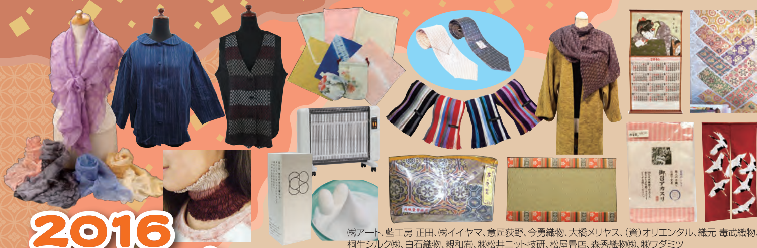
(株)アート、藍工房 正田、(株)イヤマ、意匠狹野、今勇織物、大橋メリヤス、(資)オリエンタル、織元 毒武織物、桐生シルク(株)、白石織物、親和(有)、(株)松井ニット技研、松屋畳店、森秀織物(株)、(株)ワダミツ