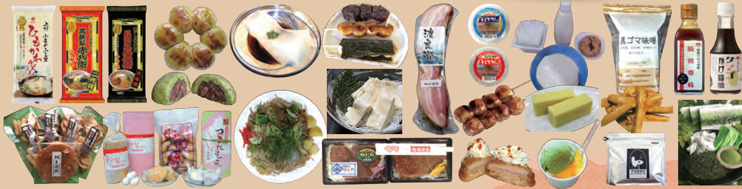
赤城豆腐 すみれ屋、居酒屋 和田、イタリアンジェラートショップミラノ、伊東屋珈琲、(株)FJ、おとおら食堂・とんかつほしの、大野屋だんご店、(株)岡直三郎商店大間々工場、(株)ぐんま製茶、(有)こまつ屋、旬菜味工房あおい、スナガ食品(株)、とことんのかみや、に志きや、B級グルメ館、(有)藤岡商店、(有)舟定、星野物産(株)、美濃屋、三吉湯 桐巨樹(きりのき)、横倉せんべい、(有)若宮