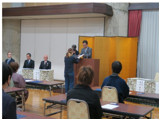
【荒木理事長より修了証の授与が行われました】