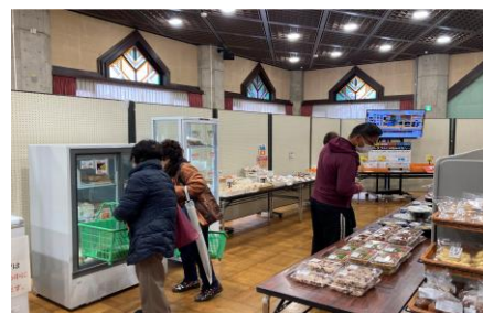
【たくさんのお客様にご来場いただきました】

当日はソースカツ丼などの弁当や、ミニトマトなどの野菜、クッキーなどの菓子等を販売し、2日間合計で665名の方にご来場頂きました。