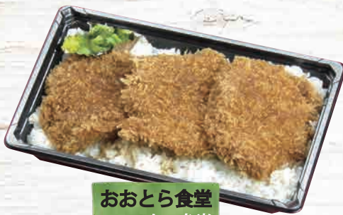
おおとら食堂 ソースかつ弁当