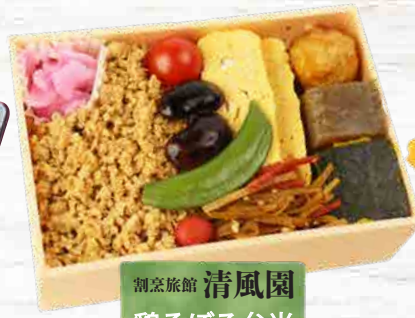
割烹旅館 清風園 鶏そばろ弁当