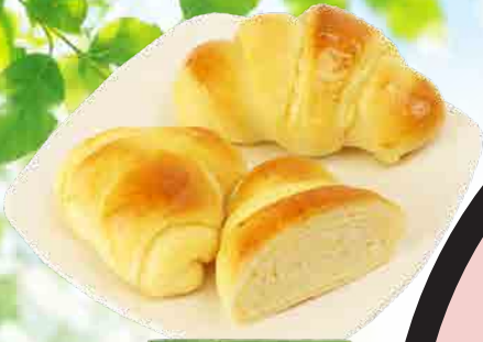
伝統の味!! シロフジ ビスロール