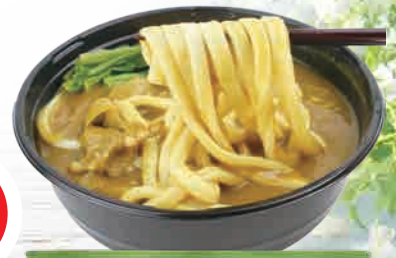
藤屋第一支店 カレーうどん