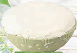
赤城豆腐 すみれ屋 ざる豆腐

※写真はイメージです。商品が売切れの場合や変更になる場合がございます。予めご了承下さい。