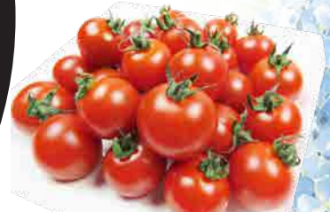
あざみ農園 ミニトマト