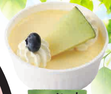
手作り菓子 いーと なめらかプリン