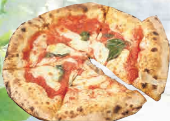
ピッツェリアダ・マキ マルゲリータ (冷凍ピザ)