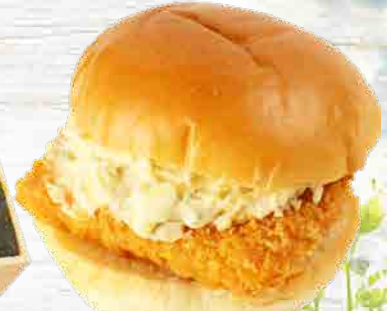
とんかつ ほしの 海老かつバーガー